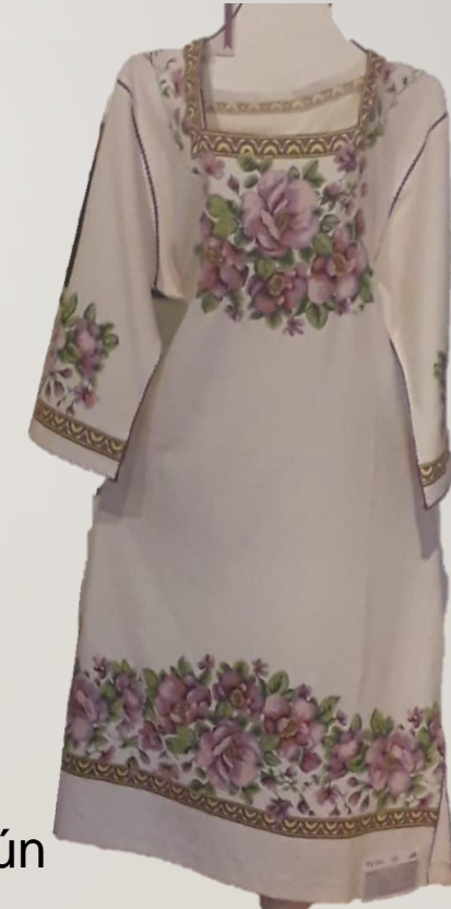
BLUSON Y VESTIDOS REGION MORELIA