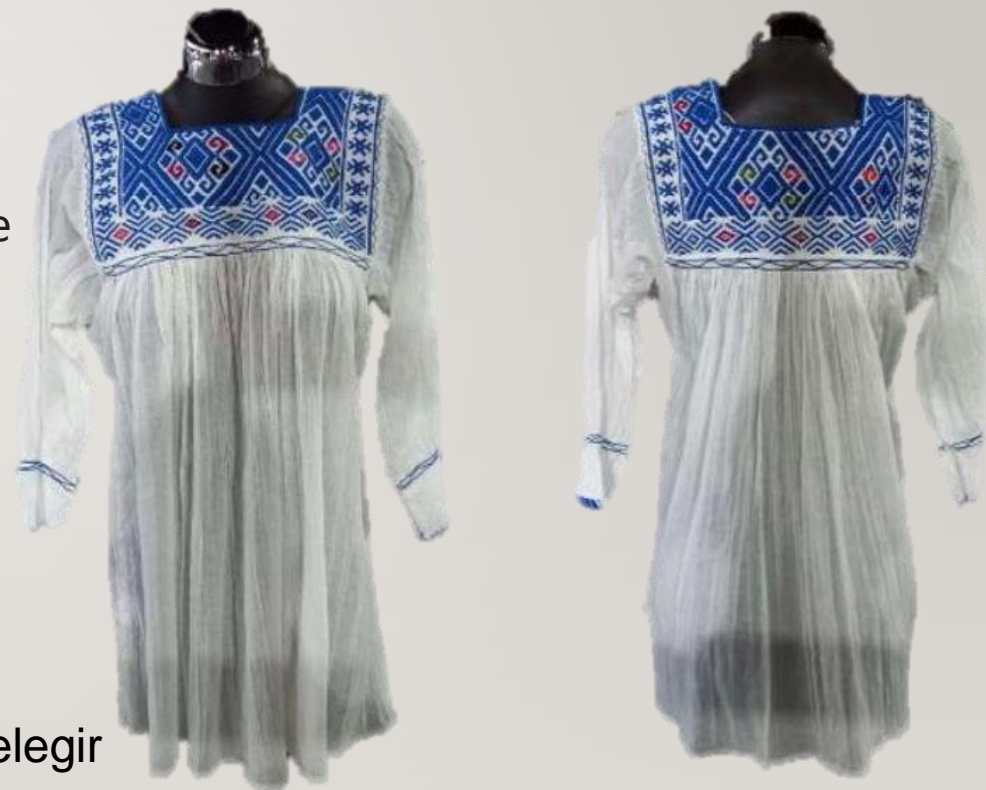
BLUSAS ARTESANAL REGION CHIAPAS