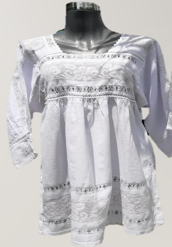
BLUSON Y VESTIDOS REGION MORELIA