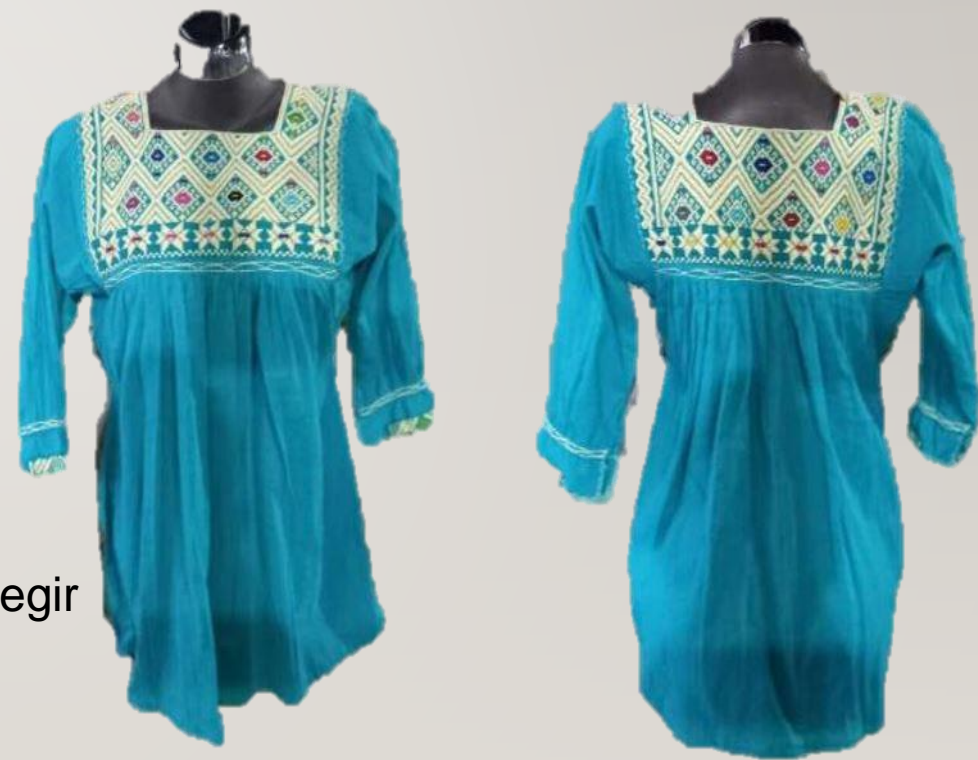
BLUSAS ARTESANAL REGION CHIAPAS

VOLUMEN: LA PRIMERA ENTREGA DE 150 PIEZAS POSTERIORMENTE SE ENTREGARA 30 PIEZAS DE CADA COLOR FRECUENCIA: MENSUAL DISPONIBILIDAD: SI HAY DISPONIBILIDAD