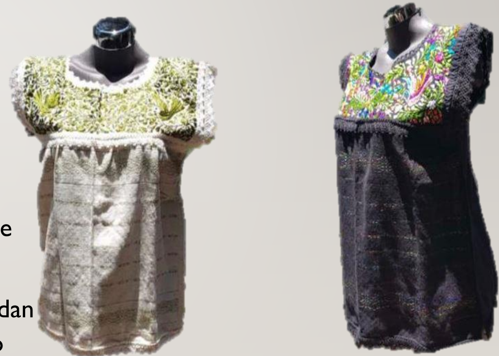
BLUSAS ARTESANAL REGION OAXACA

No cuenta con registros. Se cuenta con modista para que puedan elegir algún cambio de talla, color, y diseño. Todo con un costo extra.